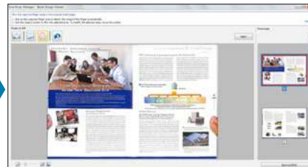
Función de retoque de punto Los dedos captados durante el escaneo pueden quitars.