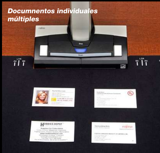
Documentos individuales múltiples