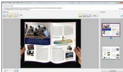
Corrección de imagen de libro Aplana y corrige la distorsión por curvatura.

Corrección Automática de Libro - Automáticamente aplana y corrige la distorsión de las páginas curvadas de libros y revistas.