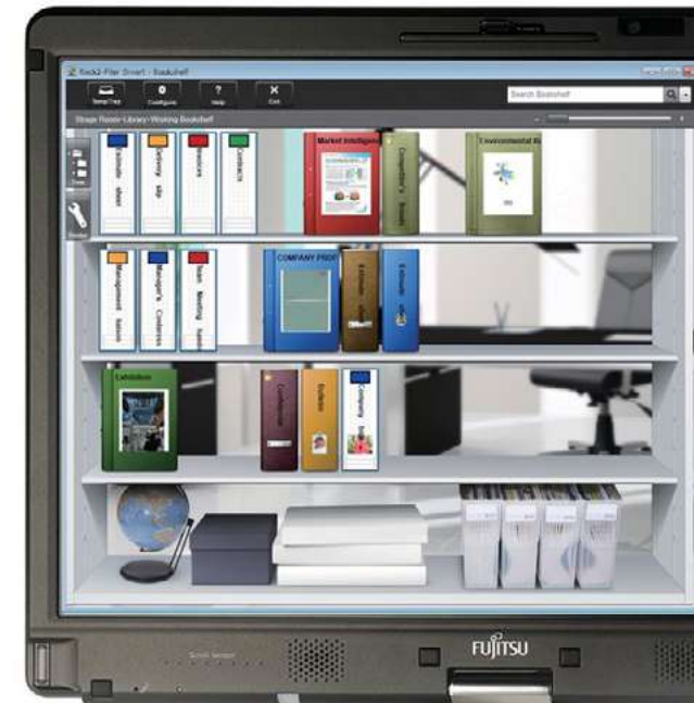
Rack2-Filer Smart with Magic Desktop (sólo para PC)

Con el software ScanSnap Organizer, CardMinder y Rack2-Filer Smart (sólo para PC) incluido, ¡es facilísimo hacer que el contenido escaneado se mantenga organizado y accesible!