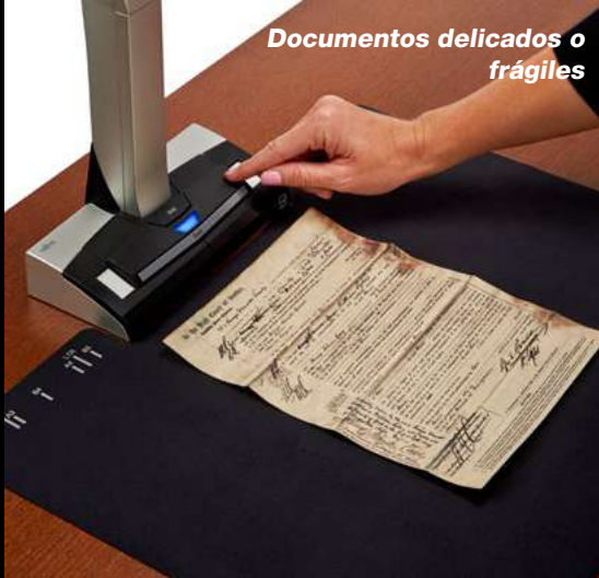
Documentos delicados o frágiles