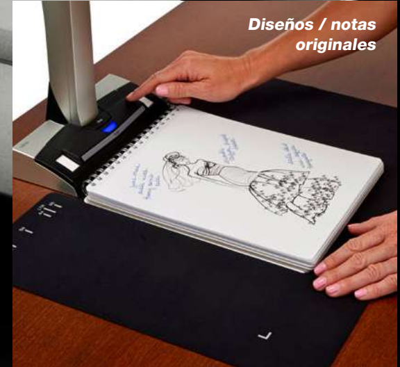
Diseños / notas originales