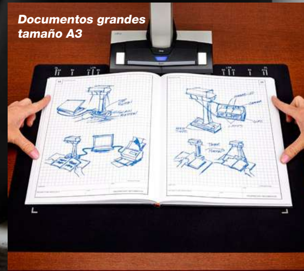
Documentos grandes tamaño A3